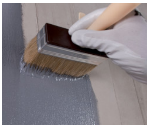
Met een kwast aanbrengen van Eco Prim Grip Plus op beton