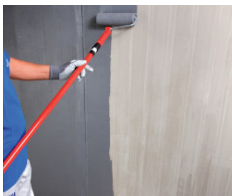
Met een roller aanbrengen van Eco Prim Grip Plus op beton

Als het product wordt gebruikt als hechtverbeteraar voor cementgebonden egalisatiemiddelen op ondergronden die zijn behandeld met epoxy- of polyurethaanprimers (zoals Primer MF , Primer MF EC Plus , Eco Prim PU 1K , Eco Prim PU 1K Turbo ) waarop geen kwartsand is uitgestrooid, moet Eco Prim Grip Plus puur worden aangebracht na volledige droging en uiterlijk 24 uur na het aanbrengen van de bovengenoemde primers. Dit type applicatie is mogelijk bij een egalisering van max. 10 mm en alleen als er geen toepassing van traditioneel massief hout wordt overwogen.